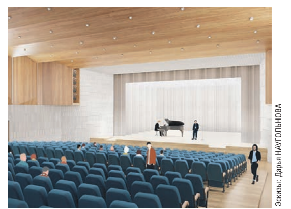
Создание: Дарья НАУГОЛЬНОВА