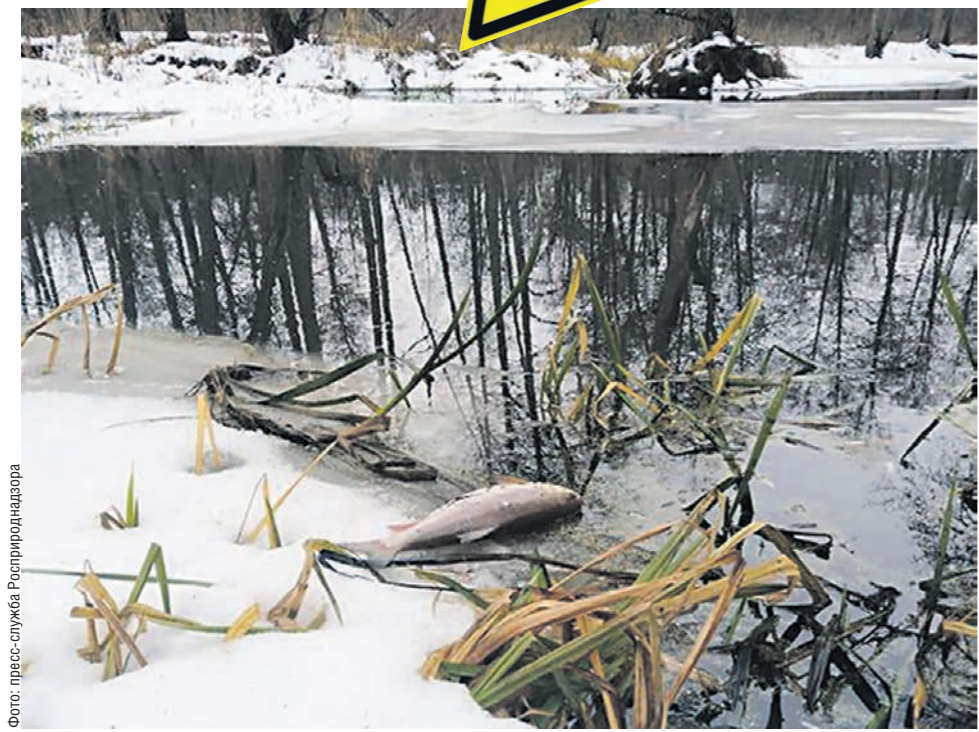
Загрязнение привело к снижению в воде кислорода, что, в свою очередь, вызвало гибель рыбы