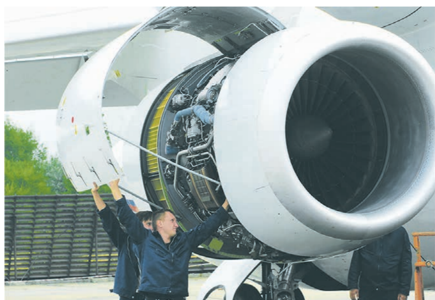
Новые технологии позволяют увеличить надёжность и экономичность самолётов