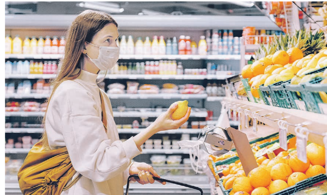
В 2020 году цены на продукты в среднем выросли на 6,7%. С апреля 2021 года ожидается очередное подорожание, но правительство принимает меры, чтобы стоимость продуктов осталась на приемлемом уровне.

для сохранения стоимости этих продуктов на приемлемом для населения уровне. Соглашения о снижении и поддержании цен могут быть продлены: на белый сахар — на два месяца, на подсолнечное масло — до октября 2021 года. Какие цифры с 1 апреля появятся в ценниках, пока предугадать сложно. По данным Росстата, со 2 по 9 марта 2021 года цены на сахар-песок в среднем по России выросли на 0,4%, на масло подсолнечное — на 0,1%, мясо кур — на 5,4%, яйцо — до 10% в отдельных регионах. Подорожание мяса кур и яиц производители объяснили ростом стоимости кормов, падением производства из-за вспышек птичьего гриппа и сокращением импорта. После проверок Федеральной антимонопольной службы птицеводы приняли решение зафиксировать цены на ближайшие два месяца. По влиянию ли это на стоимость продукции, покажет время, а пока воронежцы с тревогой ждут начала второго весеннего месяца и неприятных сюрпризов в магазинах. К сожалению, получить оперативный ответ от представителей торговых сетей по поводу возможного роста или снижения стоимости продуктов нам