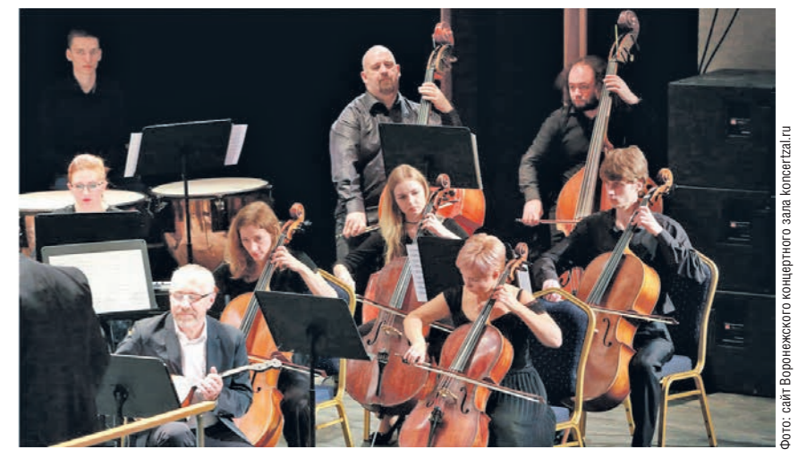
Воронежские артисты готовы радовать зрителей новыми шедеврами

Уже разрабатывается соответствующий проект. В одном из учреждений культуры в центре города появится современное музейно-музыкально-литературное пространство. Конкретный адрес назвать пока рано, но это точно будет не Литературный музей, в котором ожидается ремонт. В целом культурная жизнь в городе обещает быть насыщенной. Открывается Музей Бунина, где на открытой площадке будет проходить много мероприятий, включая литературные встречи и музыкальные вечера. В Дворцовом комплексе Ольденбургских летом откроется выставка музея Петергофа. Она разместится в доме с ризалитами. А в усадьбе Веневитиновых ожидается ряд летних мероприятий, которые позволят гостям усадьбы с пользой и удовольствием провести там время.