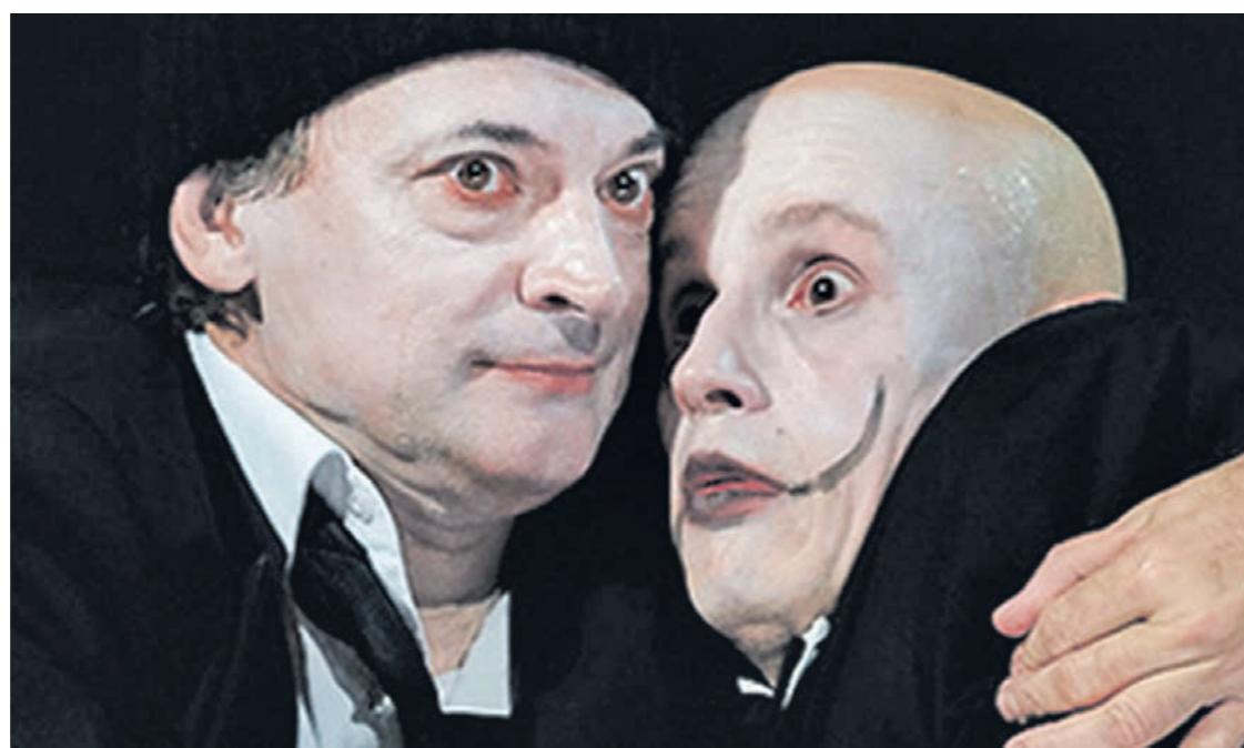
Спектакль «Сын», который покажут на Платоновском фестивале, вошёл в список 10 лучших постановок 2020 года, по версии Ассоциации театральных критиков

КУЛЬТУРА • Из-за пандемии главный воронежский культурный форум пройдёт в два этапа