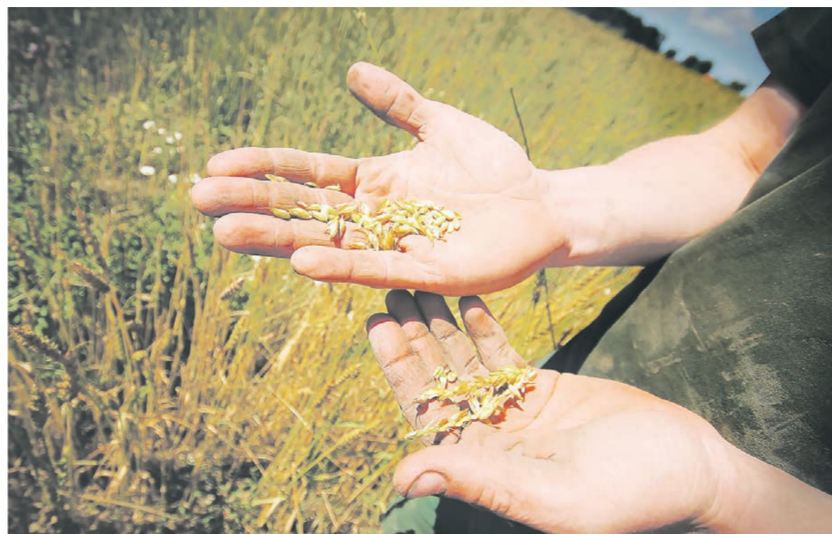
В 2020 году Воронежская область собрала рекордный урожай зерновых. Удастся ли повторить этот успех?

ЧТО ПОСЕЕМ? • Как в Воронежской области планируют справляться с гибелью озимых из-за капризов погоды