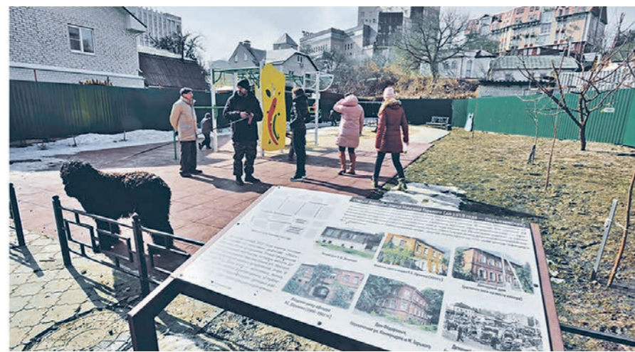
Стенд с информацией об истории ул. М. Горького стал визитной карточкой проекта ТОС

К слову, конкурс общественно-полезных проектов ТОС проводится в нескольких направлениях: благоустройство скверов, зон отдыха, детских площадок и кладбищ, ремонт дорог, системы водоснабжения, создание арт-объектов и выездных групп. В 2020 году в Воронежской области для участия в конкурсе было подано 1064 заявки, из них отобраны 859, а победили 236. Все они были реализованы на выделенные грантовые средства в том же году.