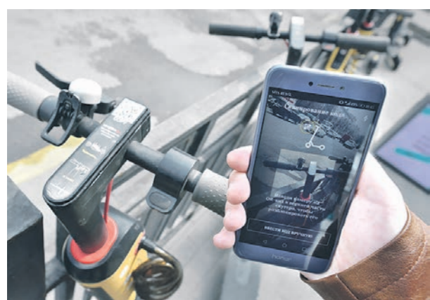
Чтобы активировать электросамокат, потребуется приложение в смартфоне

Накатавшись, ищу место на карте в приложении, где можно припарковать самокат. Бросить его где попало не получится — за это грозит штрафом в 1000 рублей. Однако парковочных мест предоставлено много — около сотни. Отвозю самокат на одно из них и завершаю на телефоне поездку. Важно, что перед этим надо сфотографировать двухколёсник на телефон и отправить фото прокатчику через приложение. Почти за полчаса катания мне пришлось заплатить 161 рубль. Сразу с меня списали 25 рублей, а уже потом пошла поминутная оплата. Одна минута — 4 рубля. Также прокатчик предлагает страховку на тот случай, если вы попадёте в аварию. Стоит она 35 рублей.