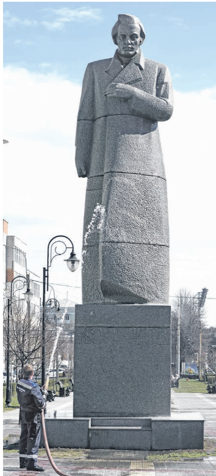
На помывку одного монумента уходит до 2 кубометров воды

ГЕНЕРАЛЬНАЯ УБОРКА • Как перед майскими праздниками приводят в порядок воронежские памятники