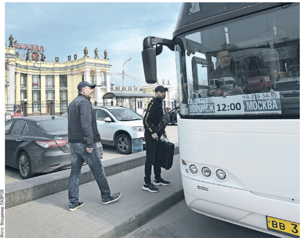
Отсутствие толп иностранных туристов может стать одним из аргументов турпоездки в Москву

Особенности: если планируете посетить пещеру, берите с собой тёплые вещи – там холодно даже летом.