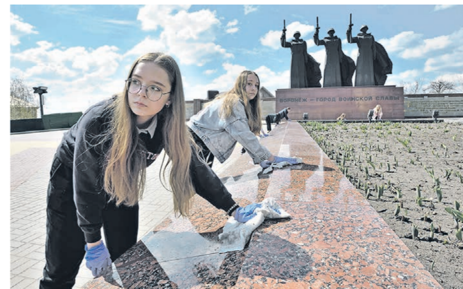
Участие в уборке воинских захоронений принимают воронежские школьники и студенты