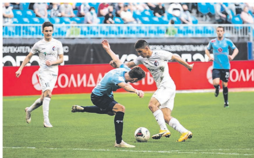
Борьба в матче была упорной, но результат воронежских болельщиков не порадовал