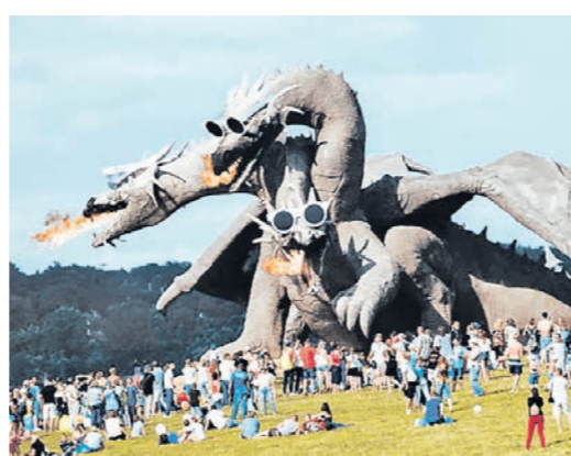
Майские праздники можно провести с огнём

Как добраться: 1,5 часа на машине или автобусом из Воронежа до Задонска. Далее на автовокзале уточнить расписание маршрутов Задонск – Калабино или Задонск – Снепное. Эти маршруты проходят мимо парка.