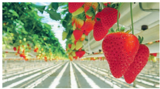
Пока ягода на даче не созрела, можно отправиться в клубничный тур

Особенности: оплата экскурсии только наличными. Дегаустация клубники и посещение музеев в стоимость тура не входят и оплачиваются отдельно.