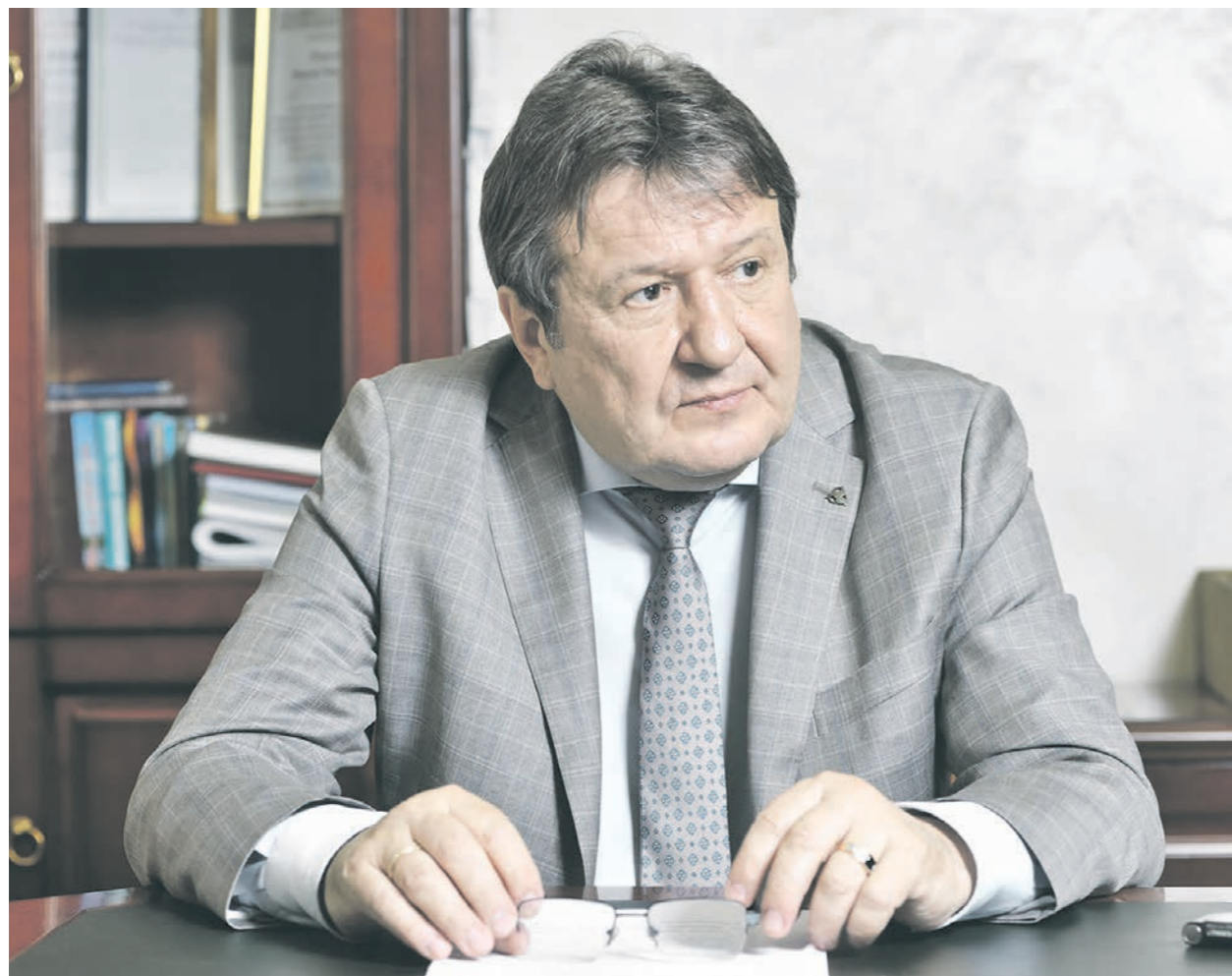
По словам Василия Тарасенко, в 2020 году департамент реализовал 180 проектов по госпрограмме вместо 90 запланированных