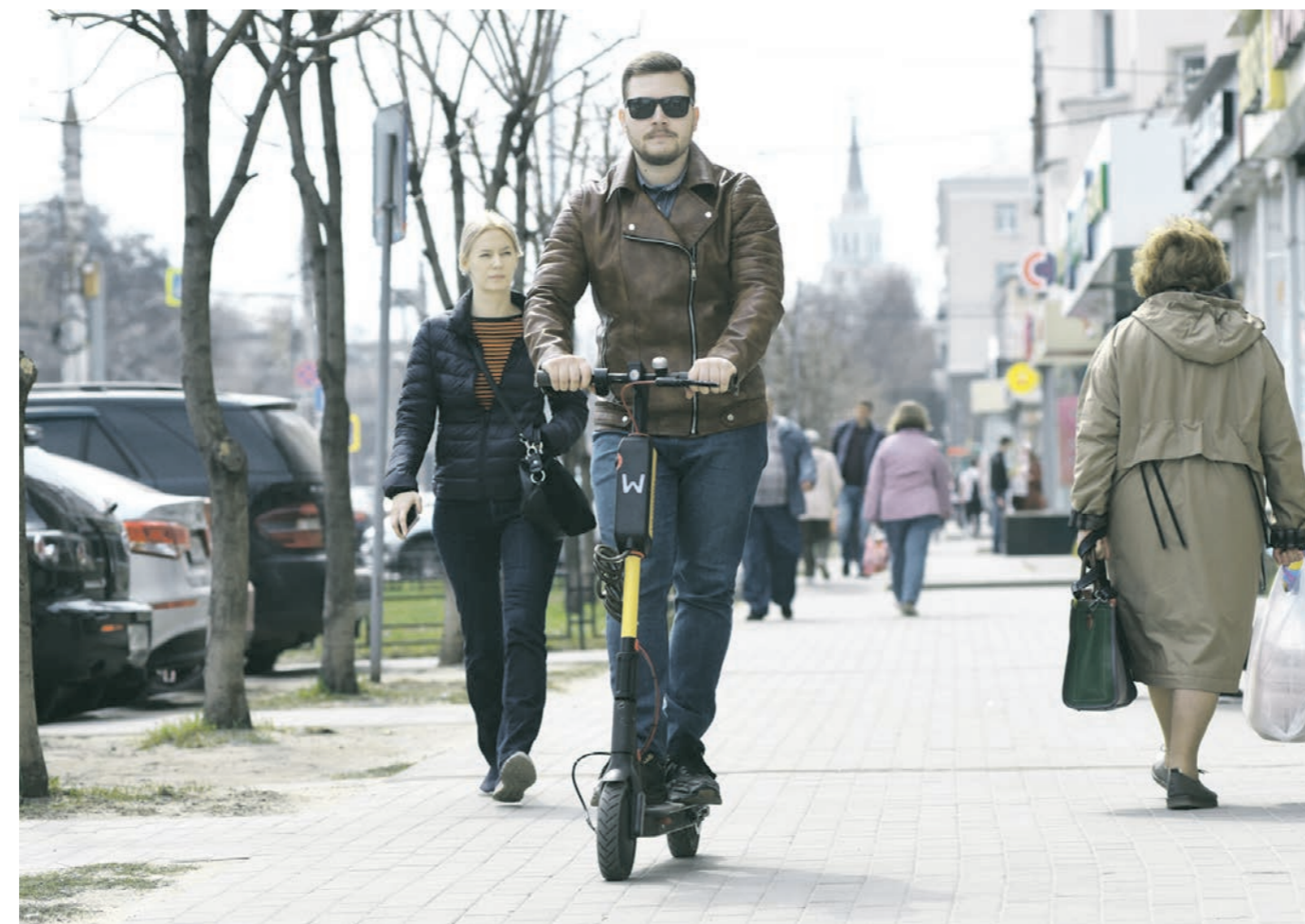
Перемещаться на электросамокате по тротуарам не очень удобно: во-первых, можно запросто сбить кого-то из пешеходов, а во-вторых, выбоины и бордюры становятся серьёзным препятствием

Получается, что аренда электротранспорта тоже обойдётся недешево: 240 рублей в час. Если вам нужно проехать три километра до дома, на предельной скорости вы потратите около 10 минут и 40 рублей. Плюс 25 рублей за разблокировку и страховка, если вы опасаетесь аварий. На всё — 100 рублей. За эти деньги три километра можно проехать и на такси.