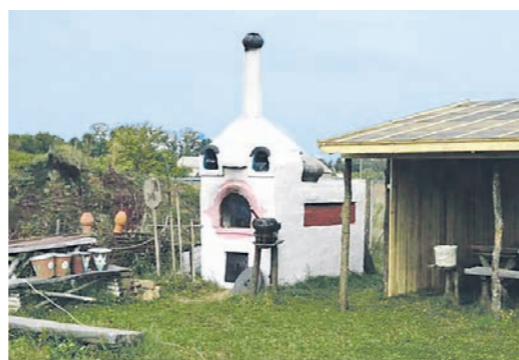
В эртыльском музее туристы могут окунуться в деревенскую атмосферу XVII-XIX веков

Особенности: в этнодеревне можно остаться с ночёвкой, в гостевом доме на 12 человек. Общая стоимость аренды – 6000 рублей в сутки.