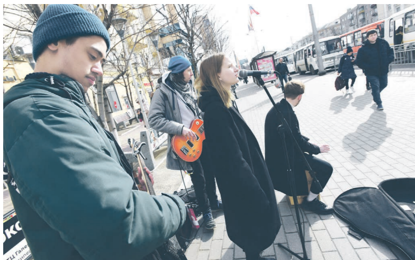
Чаще всего группу «Хит продаж» можно встретить у ТЦ «Галерея Чижова»

Ч тобы послушать песни в их исполнении, не нужно покупать билет на концерт — достаточно выйти вечером в центр города. На них нападали агрессивные прохожие и забирали честно заработанные деньги прямо посреди выступления, а ещё бросали в чехол от гитары тухлые пирожки и живого рака. С чем ещё пришлось столкнуться участникам воронежской музыкальной группы «Хит продаж», узнали журналисты «Коммуны».