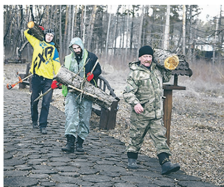
Несколько дней волонтеры занимались расчисткой дендропарка

В середине апреля волонтеры приступили к расчистке дендропарка от зарослей, подготовке почвы и посадочным работам. В итоге в нём появились 319 саженцев клёна, тополя, ивы, рябины, можжевельника, сосны, барбариса, бересклета и других растений.