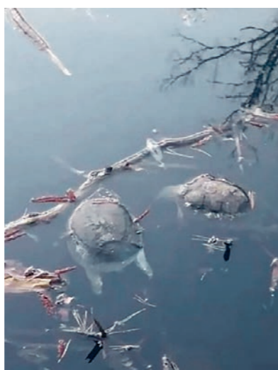
По мнению экологов, гибель некоторых черепах может быть связана со сложными условиями зимовки

Воронежцы высказывали версию, что гибель черепах может быть