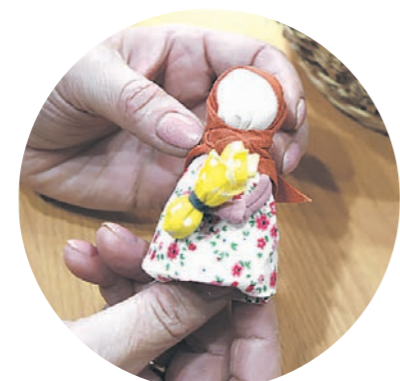
Обереговые куклы, по словам мастерицы, способны отводить беду и привлекать богатство

таем куклы-обереги, осваиваем технику лоскутного шитья. Это только сначала кажется, что собрать лоскутки в единое целое можно без навыков. Стараемся привлечь молодёжь, ведь многие из них иголку не умеют держать в руках.