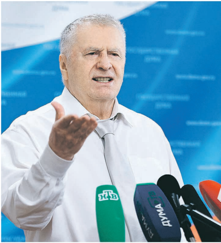
Выступления Владимира Вольфовича обычно расходятся на цитаты