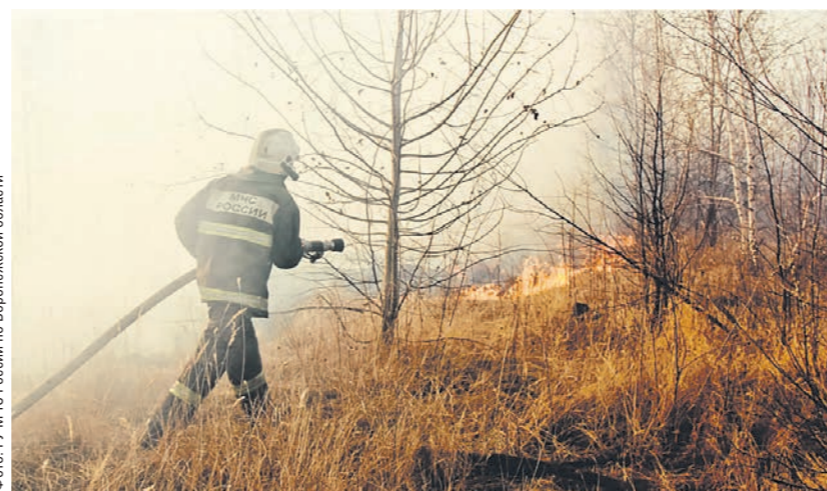
На прошлой неделе в Воронежской области бушевало несколько сотен пожаров