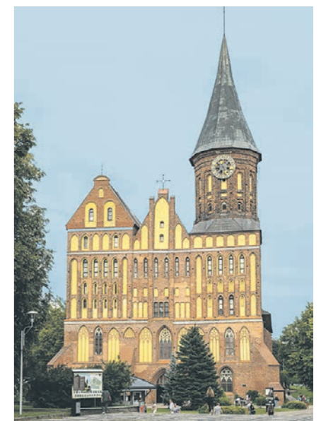
Кафедральный собор в Калининграде, где находится могила И. Канта

Как добраться: самолётом с пересадкой в Москве. Билет – от 5000 рублей.